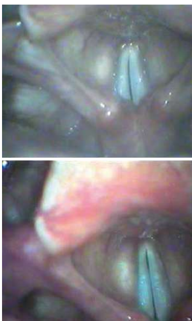
Figura 3: La misma laringe emitiendo un sonido grave (cuerdas cortas) y uno agudo (cuerdas alargadas)

El hecho más notable de la producción vocal es la vibración de las cuerdas. Sin vibraciones no hay sonido vocal: puede haber en todo caso susurro, sólo aire modulado; si las vibraciones son irregulares o se bloquean hay disfonía. El mecanismo por el que vibran las cuerdas se conoce desde 1958 como la teoría aerodinámica-mioelástica (Van den Berg). Para iniciar el sonido de la voz las cuerdas deben aproximarse a la línea media y contactar entre ellas, cerrar la laringe, de forma que el aire al salir encuentre ese pequeño obstáculo y aumente algo su presión por debajo de ellas; ese aumento de presión hace que las cuerdas se separen ligeramente desde abajo hacia arriba y que pase una burbuja de aire; el aire pasa a mayor velocidad entre las cuerdas que la velocidad que trae por la tráquea (por ser el paso más estrecho); esa mayor velocidad de paso crea una presión negativa entre las cuerdas por lo que las aspira hacia el centro, cerrando nuevamente el paso y preparándose para volverlas a abrir. Ese vaivén de vibraciones sucesivas constituye el ciclo vocal (figura 2).